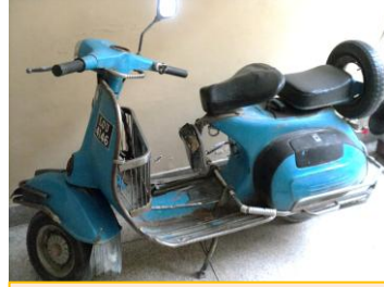
スクーター / 通勤途上に子供を学校に降ろす