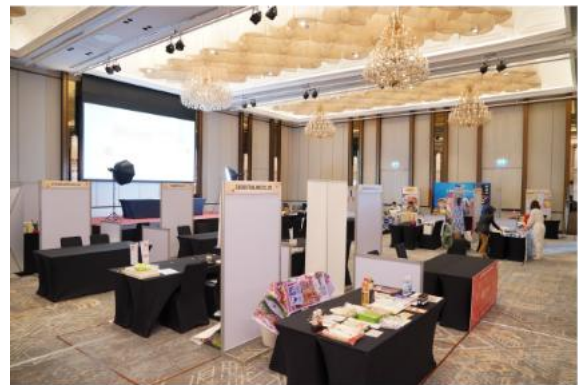
ตัวอย่างการจัดพื้นที่