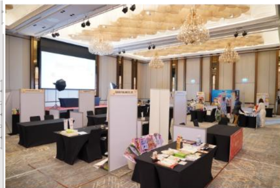
過去開催時の様子（参考）