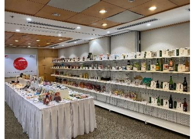
昨年度の開催風景