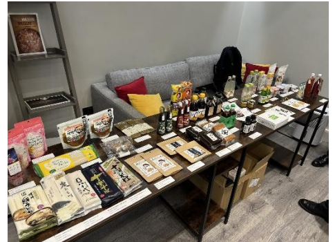
昨年度の開催風景（ロンドン）

https://www.jetro.go.jp/world/europe/uk/foods/exportguide/