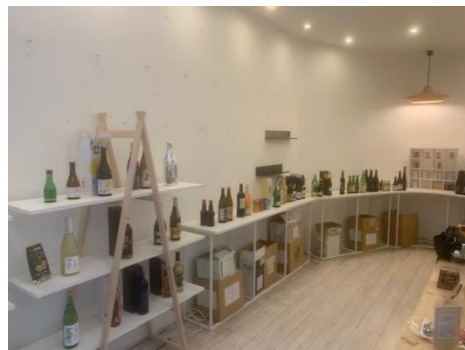
昨年度の開催風景（パリ）