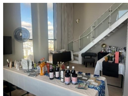
昨年度の開催風景（ヘルシンキ）