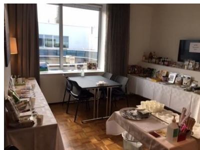
昨年度の開催風景（ストックホルム）

6月下旬 採択通知 6月下旬 事前マッチング（ストックホルム） 7月 国内倉庫への納品 8月下旬 事前マッチング（ヘルシンキ） 9月 ショールームオープン（ストックホルム） 1月 ショールームオープン（ヘルシンキ）