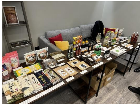
昨年度の開催風景（ロンドン）

https://www.jetro.go.jp/world/europe/uk/foods/exportguide/