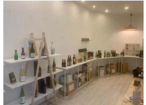
昨年度の開催風景（パリ）