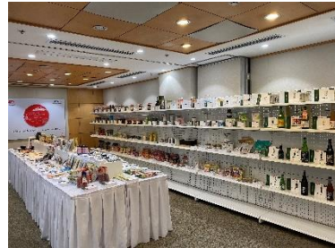
昨年度の開催風景