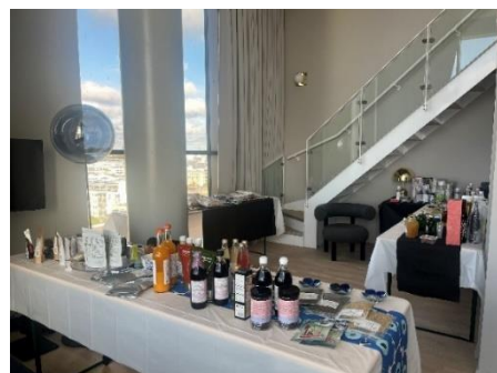
昨年度の開催風景（ヘルシンキ）