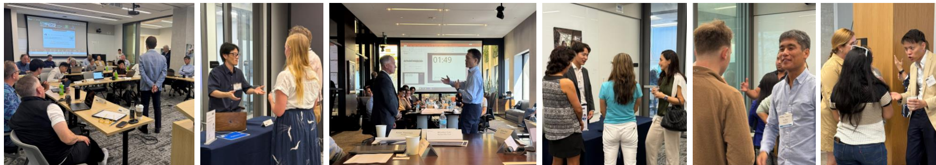
過去同プログラムの様子