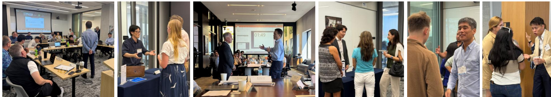
過去同プログラムの様子