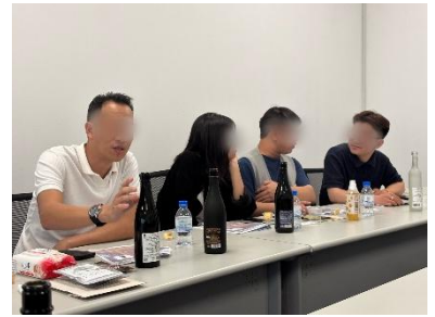
プノンペンで実施したバイヤーの試食の様子（2026年3月）