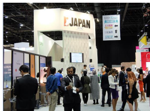
「GITEX」ジャパン・パビリオン