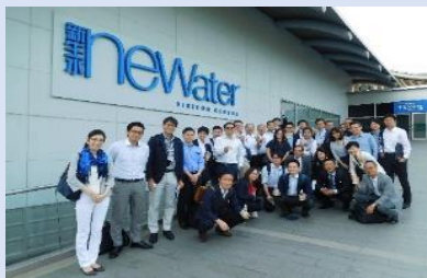
【2017年度】シンガポール：水分野 施設訪問

＜支援内容＞ ※単年度 支援先団体の企画に対してジェトロが 共催者として参加し、共同でビジネス ミッションを実施