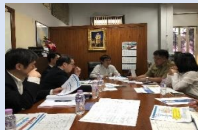
【2018年度】タイ：鉄道分野 専門家派遣の打合せ