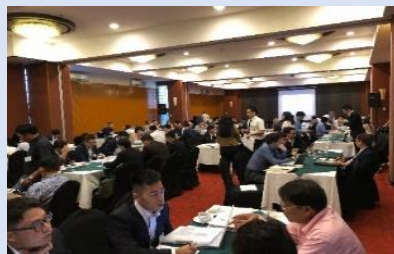
【2017年度】フィリピン：省エネ分野 商談