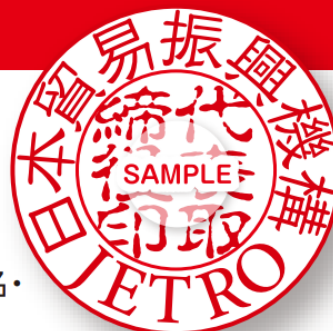
会社実印のイメージ