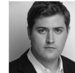
ALEX KONRAD, FORBES MAGAZINE