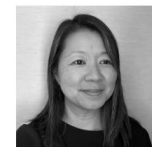
ALICE TING, THE NEW YORK TIMES