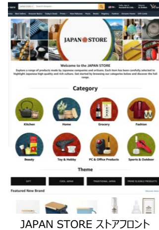
JAPAN STORE スタアフロント

Amazon（米国/英国）の購入者様向けターゲティングメールの配信を通して、ストアへの流入やシーズナルイベントへの流入を行うことで、参加企業商品への誘導を行います。