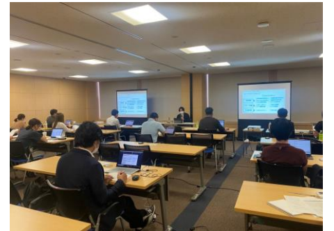
ジェトロ特別講座例