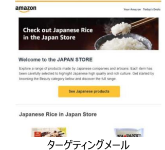
ターゲティングメール