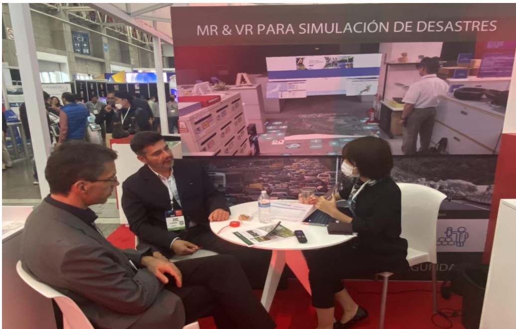
ブース内商談の様子 / Business meeting