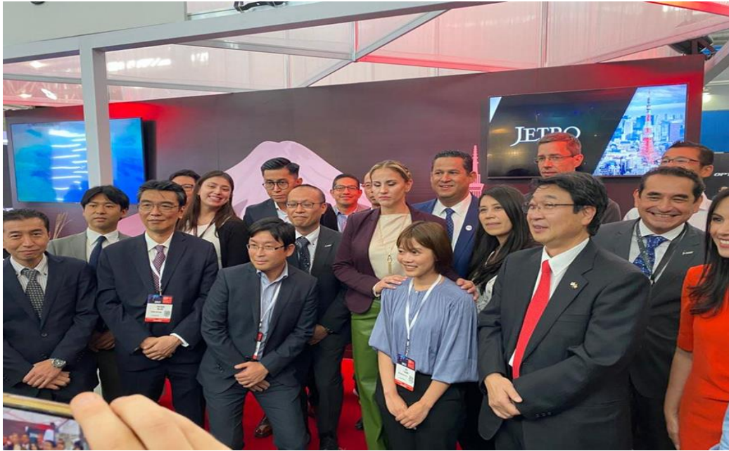
メキシコ政府要人のVIP巡覧 / VIP Tour