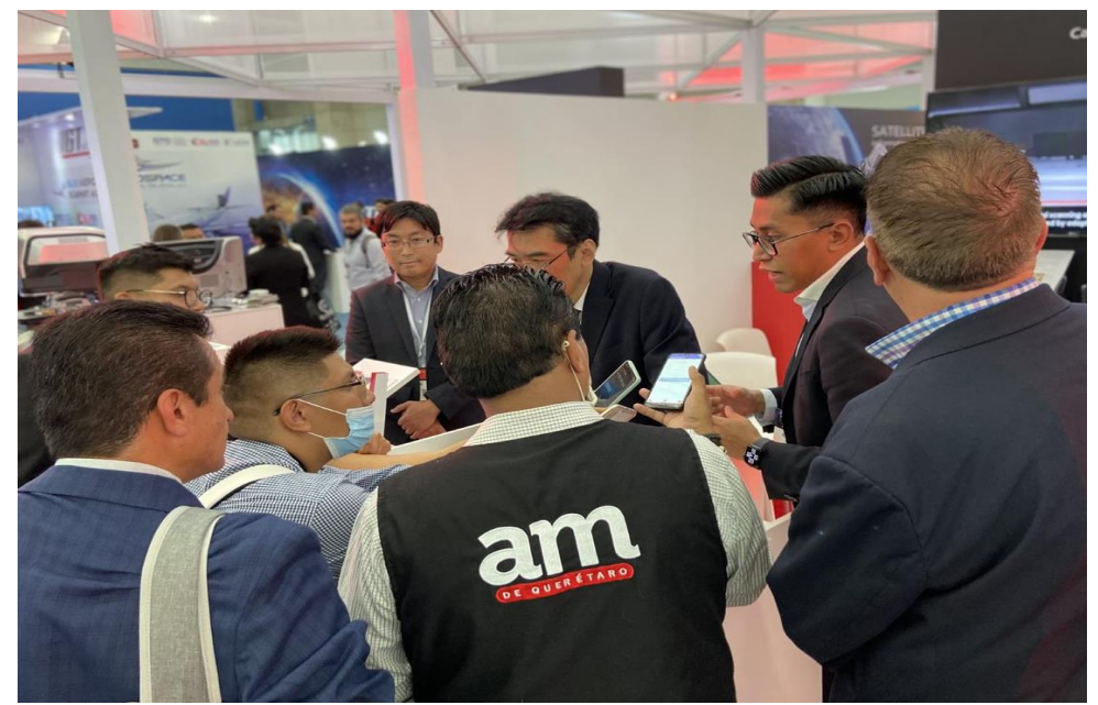
メディア向けブース紹介ツアー / Media tour at booth