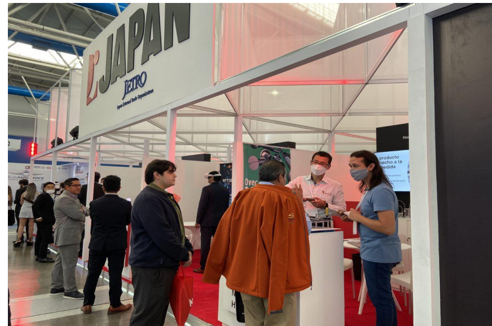
ブース内商談の様子 / Business meeting