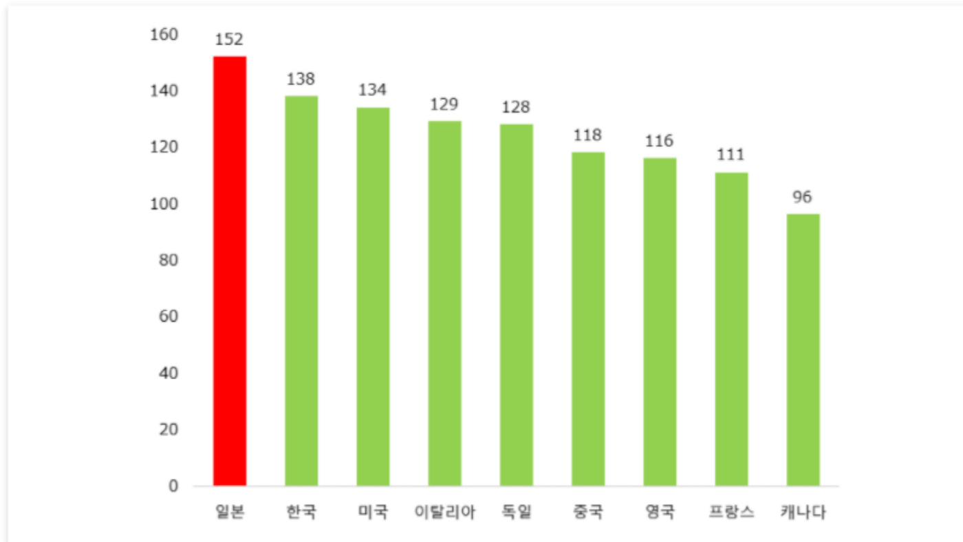
휴대전화 가입자 수(100명 당)

주:휴대전화 가입자수는 미국이 2019년, 그 밖의 국가는 2020년의 데이터 기준