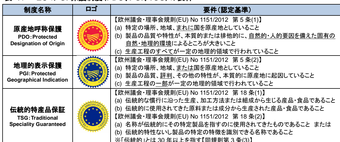
表 1: EU の GI 保護制度 (PDO、PGI、TSG) の要件