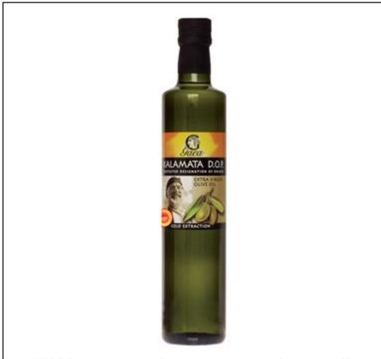
PDO登録されたカラマタ産のエキストラバージンオリーブオイル(ラベル左下にEUの定める「PDOマーク」を表示)

1995年に設立されたギリシャ食品企業 ガエア (GAEA)は、PDOを自社のオリーブオイルの販売に活用している。同社は従業員54人(2013年3月時点)の中小企業だが、売上高(2012年)の82%は輸出だ。同社は、クレタ島シティアやカラマタ(ペロポネソス半島南部)産などのPDO登録されている国内産のオリーブオイルを利用している。