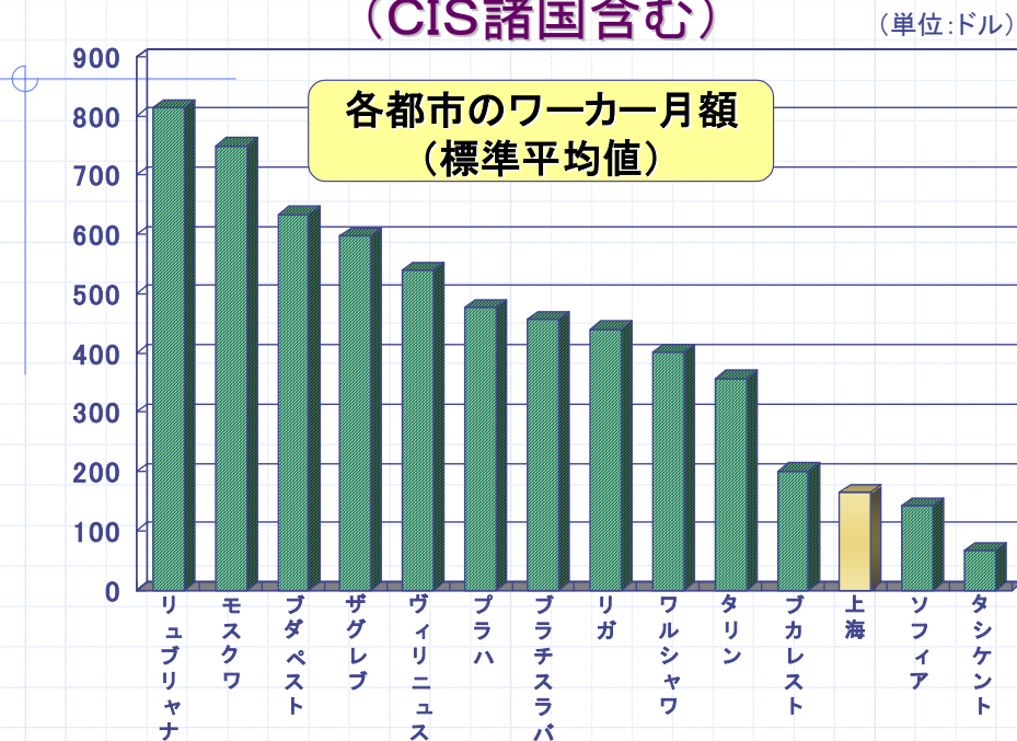
図2. 中・東欧の賃金水準比較 (CIS諸国含む)