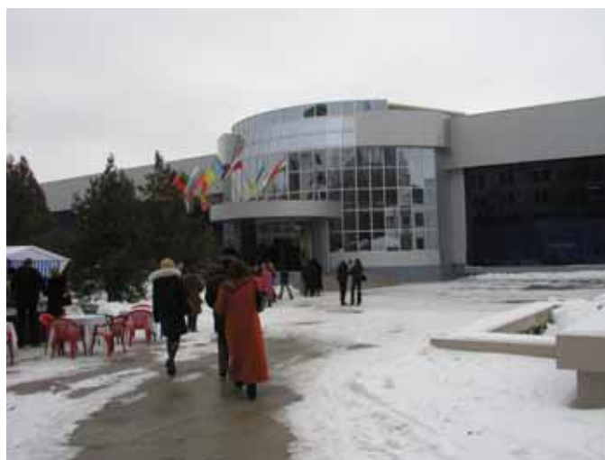
Expo Vin Moldova 2003 会場