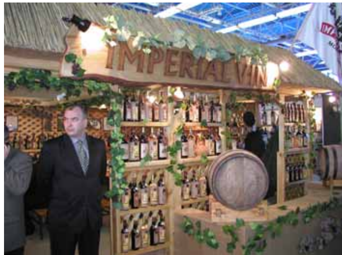
Expo Vin Moldova 2003 会場