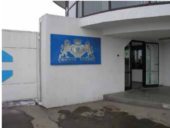
Cricova Acorex 社