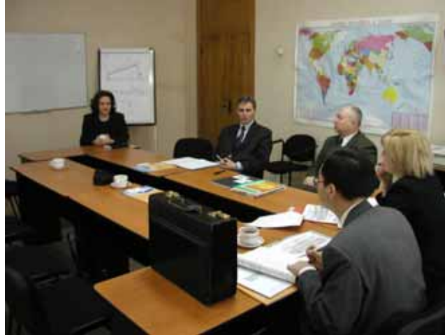
モルドワ輸出振興機構（MEPO）との面談