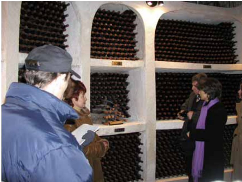
ゲーリング コレクション