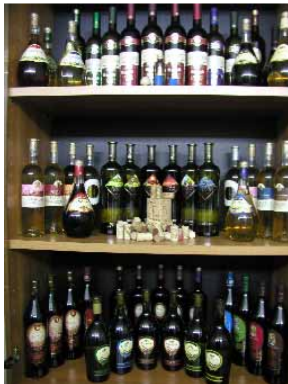
数々の国際コンクールで入賞