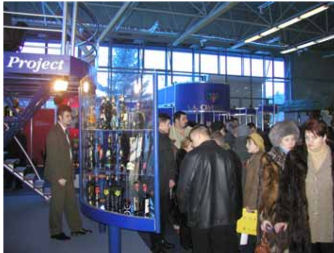
Expo Vin Moldova 2003 会場