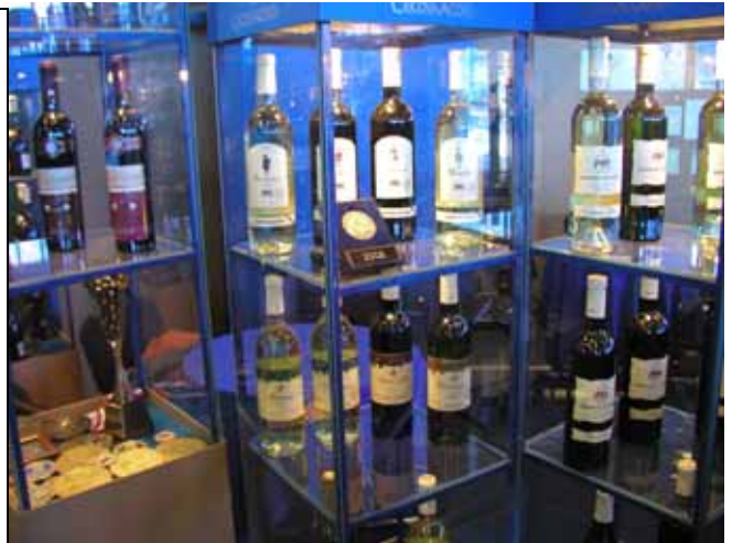
(同社展示品参考写真)