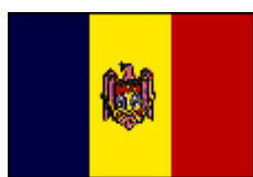
モルドワ共和国 国旗

気候は大陸型で、黒海の影響により、比較的温暖で短く湿度の高い冬と、乾燥して長い夏が特徴である。1 月の平均気温は -5 ~ -3 (北部~南部) 7 月は 19.5 ~ 22 (北部~南部) であり、年間降水量は 405 ~ 550mm (南西~北部) となっている。