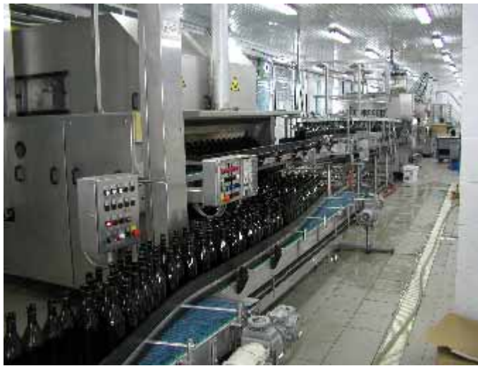
Cricova Acorex 社