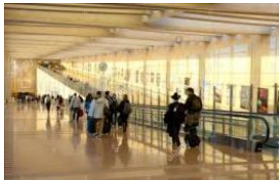
写真：ベングリオン空港到着時に通過する長い下り坂（イミグレーション手前）

降機後、表示に従いイミグレーションにお進み下さい。長い下り坂の先にイミグレーションがあります（写真参照）。