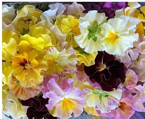
種類により味わいが異なる エディブルフラワー

・タイ国内にもエディブルフラワーはあるものの、同社の花にはない農薬使用による強い苦みがあることを知り、その点で他社との差別化を図れることが明確になる。単なる飾りとしてではなく、シェフの思い描く形と味に沿うことのできる食材として更なる販路を拡大中。