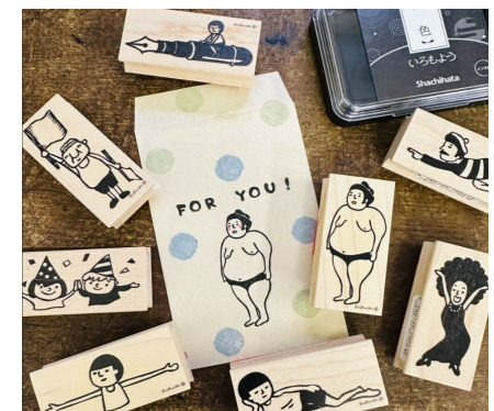
まもるくんほか各種キャラクター