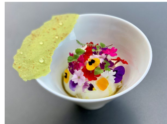
ミシュラン星付きレストランのシェフも愛用