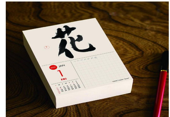
KOYOMI（日めくりカレンダー）