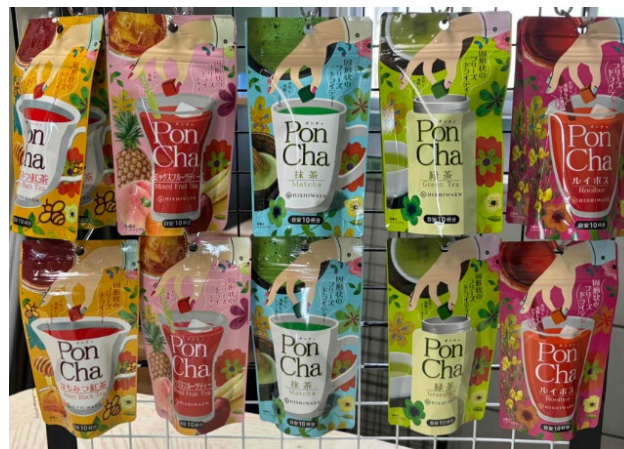
フリーズドライ キューブティー