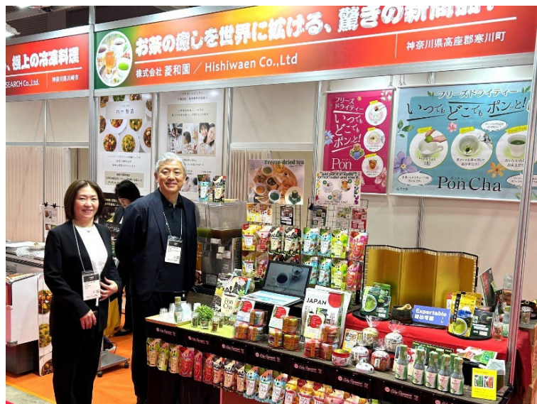
展示会FOODEX出展の様子（東京ビッグサイト）

・足がかりを作ったシンガポールでの販売拡大を目指すと同時に、2025年は新たにオーストラリア、アメリカをターゲットとして営業活動を進めていく。