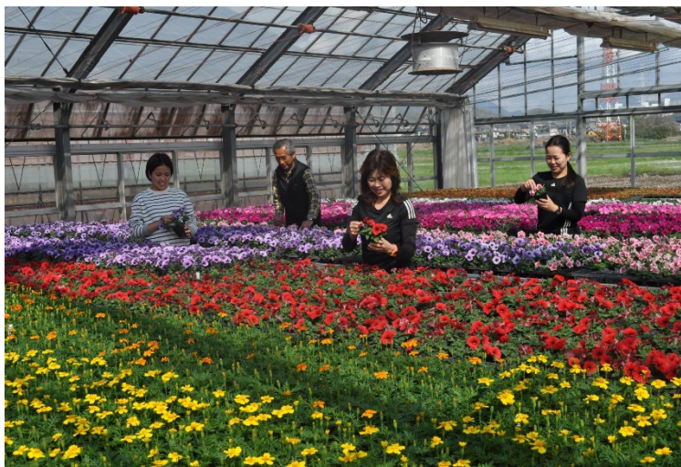
花園で生産される各種の花