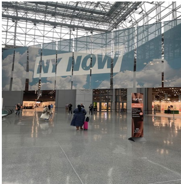
2024年8月 NY NOW会場