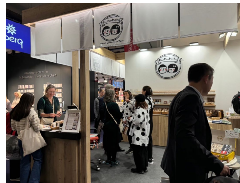
ドイツ展示会アンビエンテ出展風景