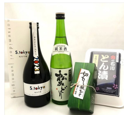
S Tokyo.を含むセット商品