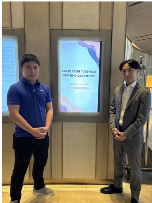
2024年11月 Validator Vietnam 開所式