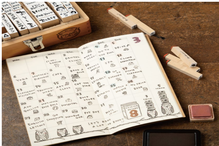
スケジュールはんこ