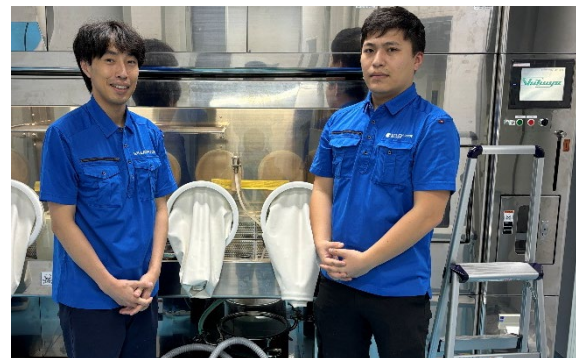
ベトナムでの最初のバリデーション現場