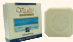
Mineral Soap ミネラル・ソープ 死海の塩とミネラルがベースの、マイルドな使い心地の石けん。植物オイル配合で、肌を柔らかく滑らかに仕上げます。 ◎使用期限(製造日から):5年