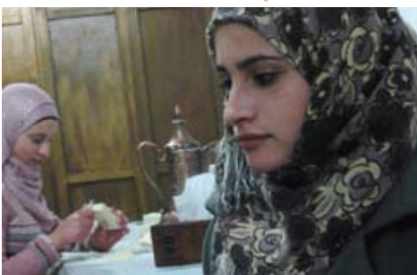
女性の雇用創出を掲げ、全工程を手作業で行っています。左奥は面取り作業を行う女性。