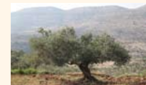
Wizard社はオリーブの木に囲まれています。