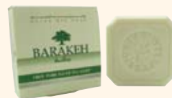
100% Pure Olive Oil Soap 100% ピュア・オリーブオイルソープ 純粋なオリーブオイルを贅沢に使ったソープ。 ◎使用期限(製造日から):5年