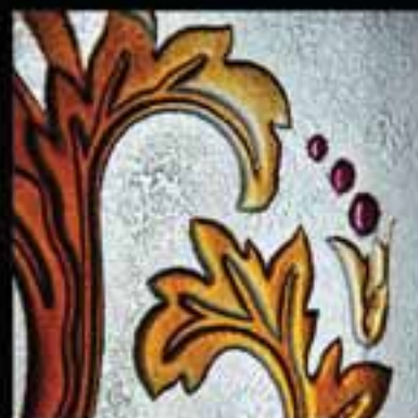
3-Stained glass work