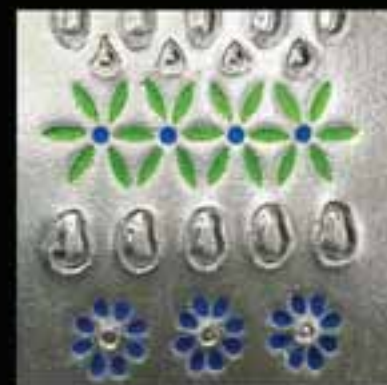
4-Stained glass work