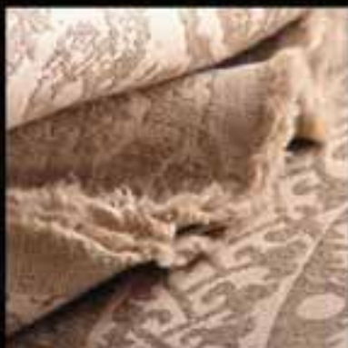
6-Fabrics / Coptic design