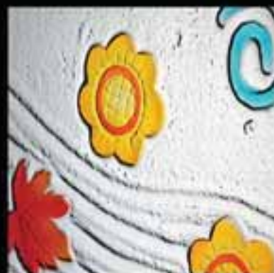
2-Stained glass work