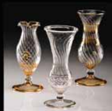
8-Single flower vase