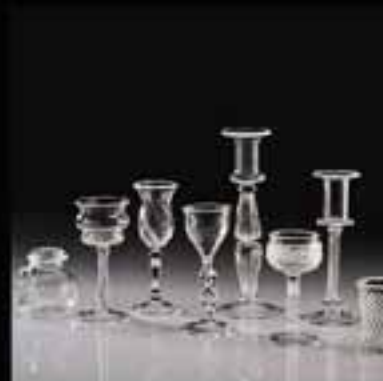
12-Glass & candle stand