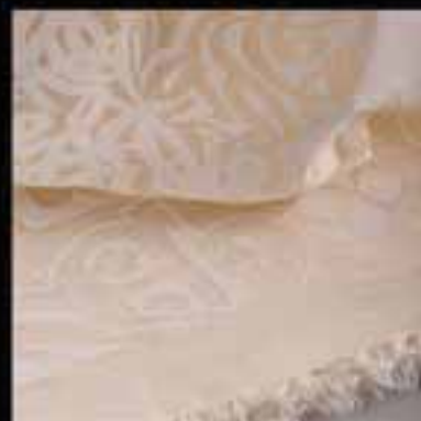
8-Fabrics / Arabic calligraphy