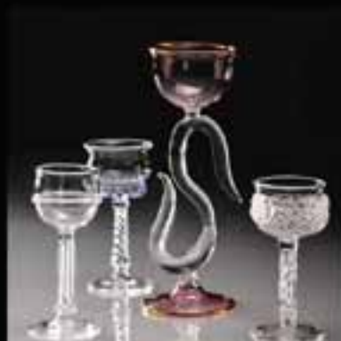
5 Sherry glass