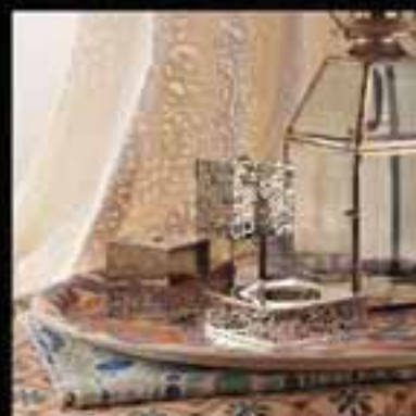
12-Metal work, Lantern, Table mats