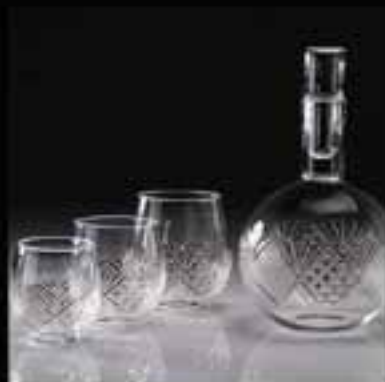
2-Glass cup set