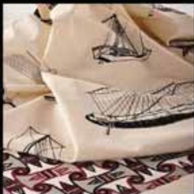
2-Fabrics / Printed