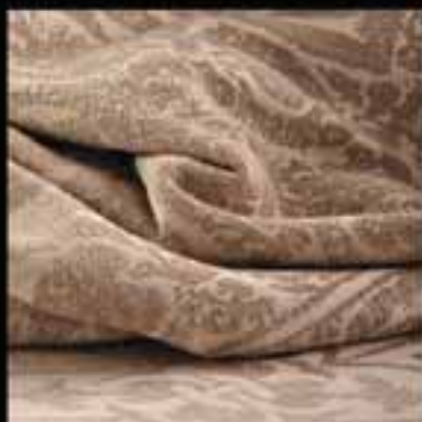
5-Fabrics / Coptic design