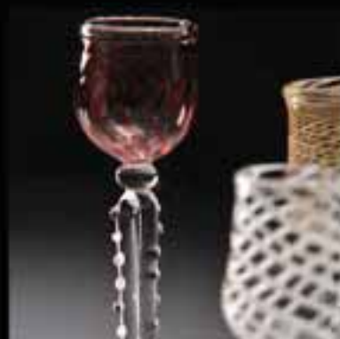
7 Sherry glass