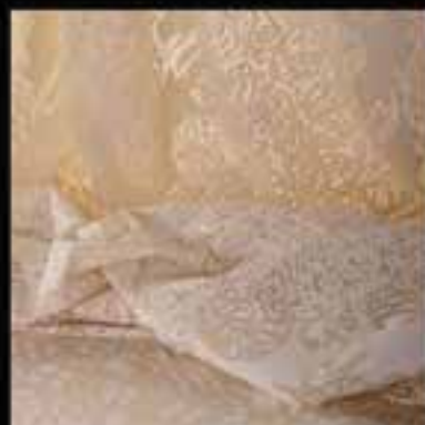
7-Fabrics / Arabic calligraphy