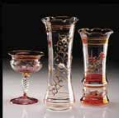
10-Glass, Flower vase