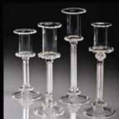
8 Candle stand