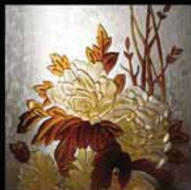
1-Stained glass work