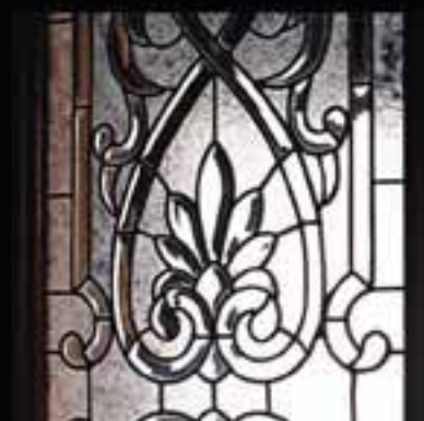
5-Stained glass work