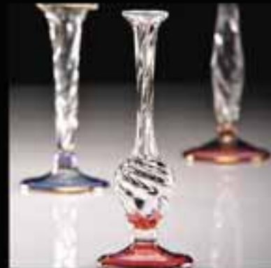
4-Single flower vase