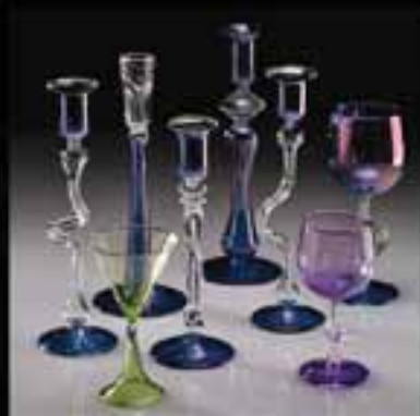
6-Candle stand, Glass