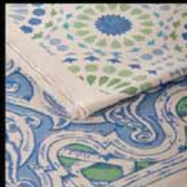
4-Fabrics / Printed