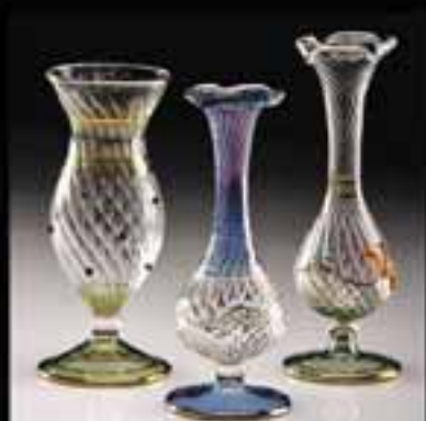
9-Single flower vase