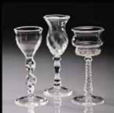
6 Sherry glass