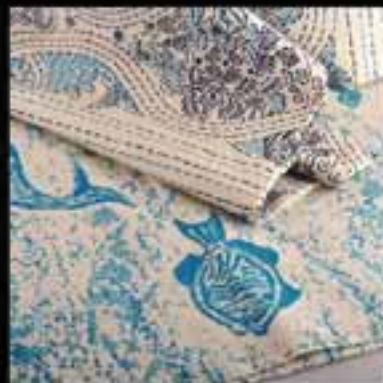
3-Fabrics / Printed