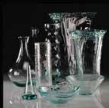
12-Flower vase & table ware