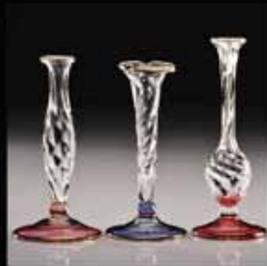
3-Single flower vase