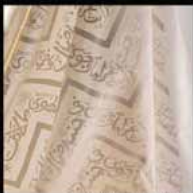
10-Fabrics / Arabic calligraphy