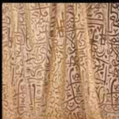
9-Fabrics / Arabic calligraphy