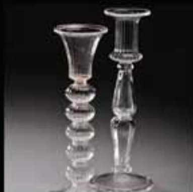
9 Candle stand