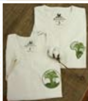
ウガンダ「オーガニックコットン製品」