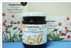
ケニア「ジャム、有機ハーブティー」