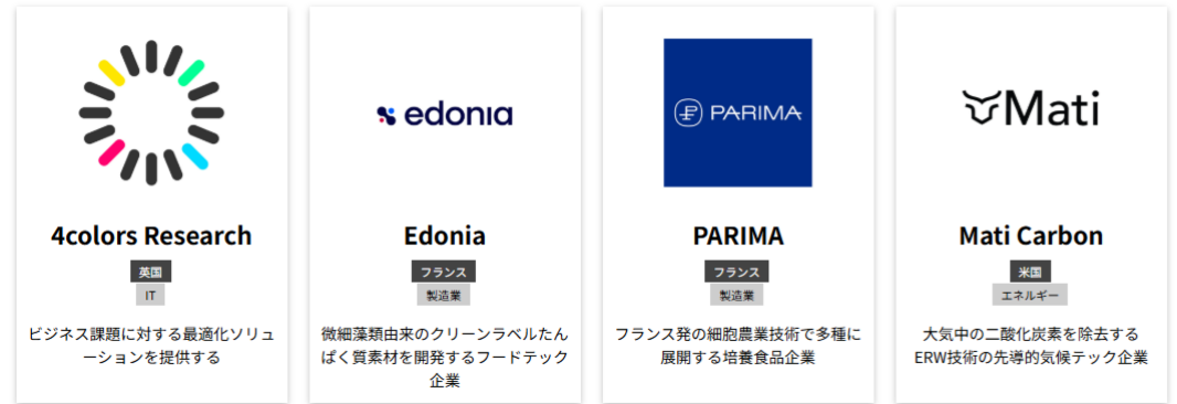
J-Bridge「海外有望企業情報」

※初回利用時にはジェットロ「お客様登録」が必要となります。「お申込み画面フロー」のスライドをご確認ください。