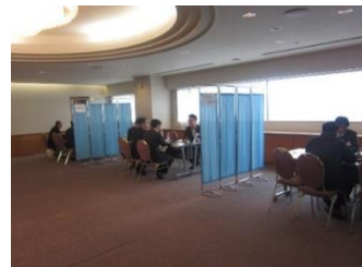
(商社マッチングイメージ図)