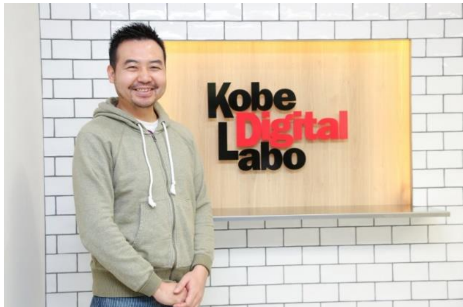
תמונה של הדירקטור והמנהל הכללי של חטיבת היצירה העסקית של Kobe Digital Labo בע"מ,