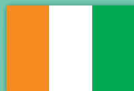
The Republic of Côte d'Ivoire