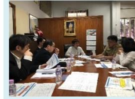
【2018年度】タイ王国・鉄道分野 【2017年度】中国・水処理分野 専門家派遣での打ち合わせ 有識者招へいでの施設訪問