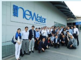
【2017年度】シンガポール・水分野 【2017年度】フィリピン・省エネ ミッション派遣事業での施設訪問 分野ミッション派遣事業での商談