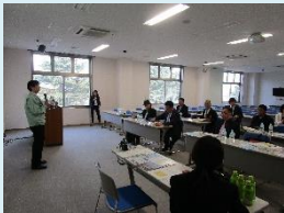
セミナー・イメージ