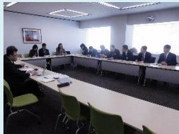
研究会・イメージ