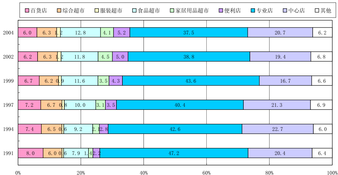
图表5 各种业态的全年销售额所占份额的统计

(注)专业店指同类商品占90%以上的商店，中心店指同类商品占50%以上的商店（专业店除外）。 (资料来源)经济产业省《商业统计调查》