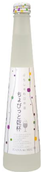
引き合いが続く新商品 「ちょびつと乾杯」

海外市場開拓を始めるにあたり、最初に始めるべきことはターゲット市場の選定です。有望なマーケットを探すため、現地に出張して市場を調査しました。私は海外出張に行くとき、バイヤーと面談する前に現地のジェトロ海外事務所を訪問し、海外フリーフィングサービスを利用します。本サービスでは、その国の経済概況から、日本食市場のトレンド、日本酒の輸入規制まで幅広く情報を