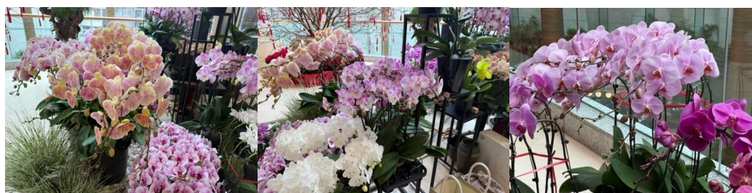
<写真:高級フローリスト Anterra Florist d の胡蝶蘭 (左・中央) 台湾産/ (右) 同・日本産 >

胡蝶蘭は直射日光に弱く、木陰のように柔らかな陽光を好む傾向がある。その反面、光が少なすぎると蕾落ちの原因にもなりやすい。ところか、日本産胡蝶蘭の中には、産地の技術によって天候の変化に左右されにくいなど、目には見えない創意工夫がなされている商品がある。日本産胡蝶蘭は花の大きさや花の並び方が美しく、日持ちも良いことから、香港市場では他国産胡蝶蘭と比較して高品質なものとしてみなされており、旧正月のシーズンのみならず、法人や個人のギフトとして通年の需要がある。