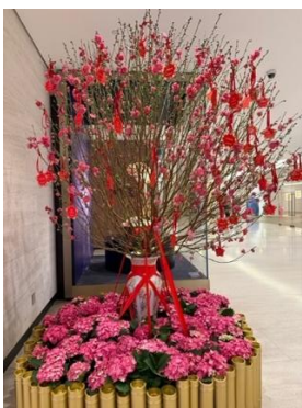
<写真:セントラルのショッピングモールに飾られる桃の木 (左) >

香港では、旧正月になると縁起の良い花や植物を飾って新年を迎える習慣がある。たとえば、蜜柑や金柑の柑は「吉」と同じ発音であるため、縁起を担いで旧正月の時期に飾られる。桃の花は人との縁を、牡丹の花は富貴を意味するため、これも縁起物として香港の人々の間で好まれている。また、胡蝶蘭は名前による験担ぎはないが、手入れがしやすく華やかであるため、香港の人々に好まれている。