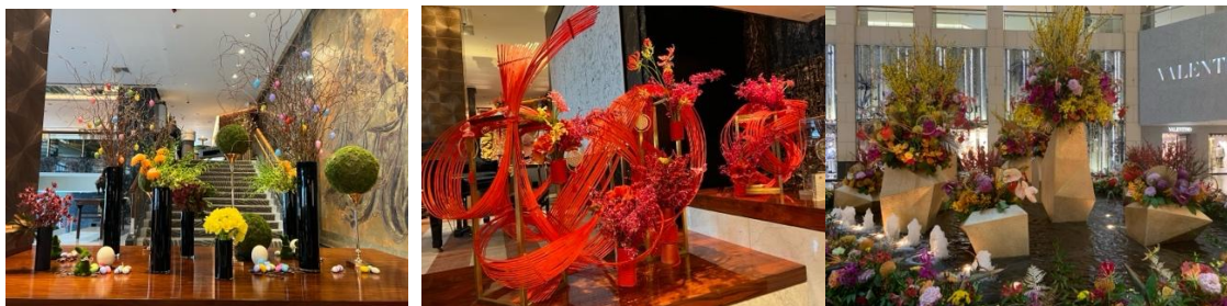
< (左) マンダリンオリエンタルのロビーの様子 / (右) ショッピングモール「ランドマーク」の様子 >

その一方で、法人向けについては、ショッピングモールや商業施設、ホテルの装飾、企業のオフィス、イベントなどの場面において、一部では切り花が用いられることがあるが、造花が使用される場合も多い。