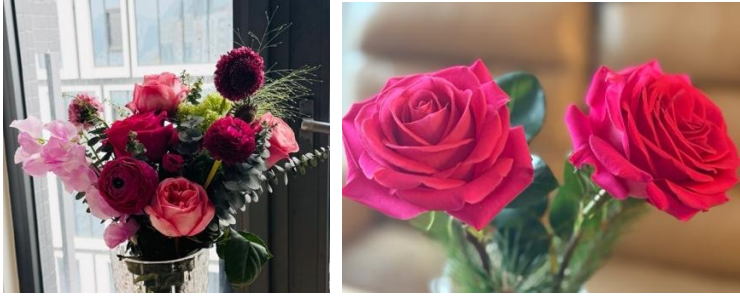
<写真: (左) オランダ産バラの花束 / (右) 南アフリカ産のバラ >

カーネーションやバラ以外にも、日本から香港へは、ラナンキュラスやグロリオサなど、さまざまなタイプの花が輸入されているが、それらは香港統計局 5 の統計分類上「その他の切り花」として整理されている（輸入金額・輸入量の推移は以下の表のとおり）。