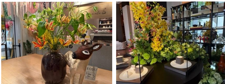
<写真: (左) Armani Fiori 8 も担う Gary Kwok Flowers & Design 9 に飾られる日本産グロリオサ/ (右) Rosewood Hotel 10 に飾られる胡蝶蘭と日本産グロリオサ >

現在の香港の花き市場では、オランダのエージェントが主要な供給元となっているが、オランダが供給できない種類の切り花や、日本産の方が優位性のある切り花については、日本産の切り花が支持される傾向がみられる。フラワーアレンジメントを行う企業からのヒアリングによると、日本産切り花に対するニーズはあり、中でも、グロリオサやスイートピー、ラナンキュラス、ダリアなど、花のサイズの大きさや優雅さ、切り花の背の高さ、香りの良さ、色みなどで他国産と差別化できるアイテムについて、香港では需要がある。