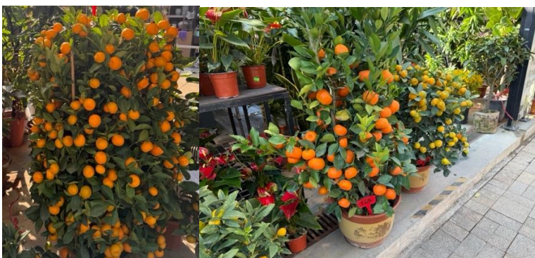
<写真:旧正月前に販売されるみかんの木 (左) / (右) 金柑の木 >