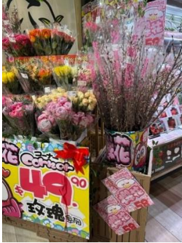
<写真:Don Don Donki で販売される日本産切り花 >