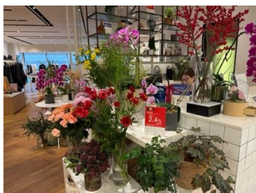
< 写真: Agnes b café & fleuriste 3 の様子 (筆者撮影) >