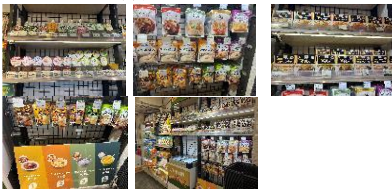
<写真：City Super でのケアフード売り場の様子>

多くのスーパーマーケットでケアフードが流通していない中、City Super 27 では、数年前からケアフードの売り場を拡充している。他国産ケアフードはほとんど販売されておらず、主に日本製のレトルトパック入りのケアフードが展開されている。