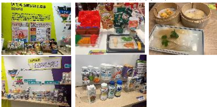
＜写真：プロジェクトフューチャーズの店舗の様子＞

また、プロジェクトフューチャーズでは日本産レトルト入りのケアフードや凝固剤を販売するだけではなく、家庭で嚥下食を楽しめるように料理教室を行っている。