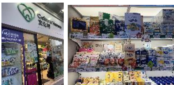
＜写真：文化村のセントラル店の様子＞

真善美医護（Just Med Ltd）では、主にアサヒフードアンドヘルスケア社やエバースマイル社のレトルト入りのケアフードが販売されている。種類も豊富である。