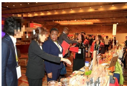
▲令和7年度開催の様子