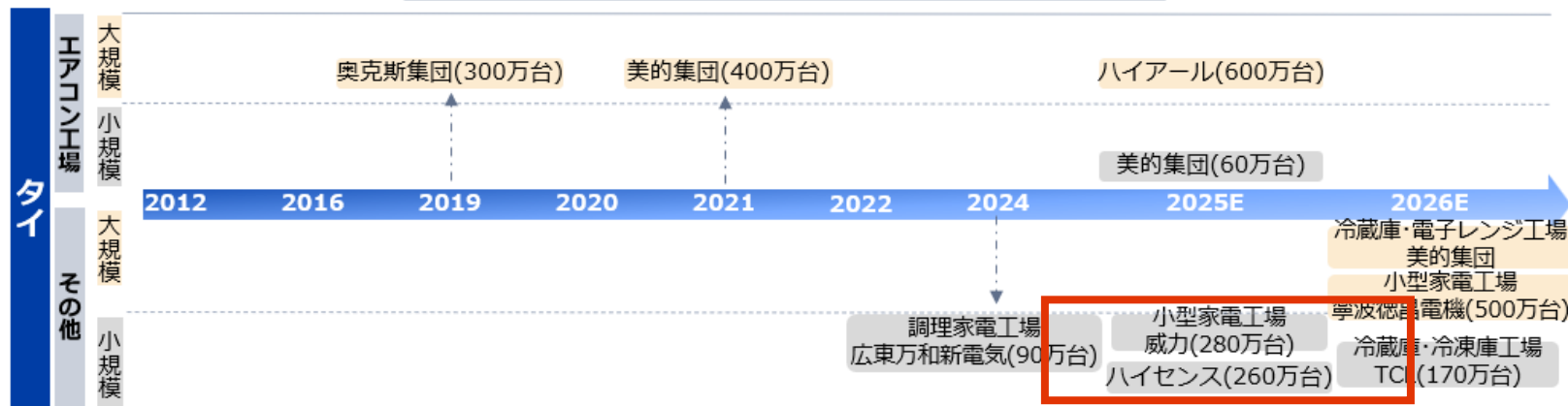
工場稼働開始年別家電業界関連工場進出企業とその生産能力