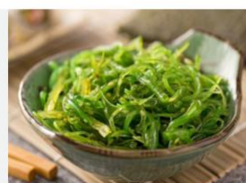
ALGA MARINHA TEMPERADA VEGETAIS