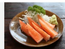
KANI STICK PREPARADOS