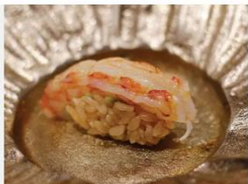
CAMARÃO ARGENTINO CRUSTÁCEOS