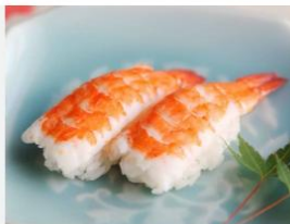
CAMARÃO ROSA - AMAZONAS CRUSTÁCEOS