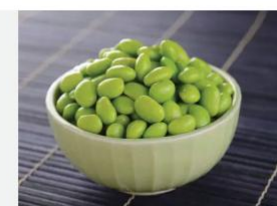
EDAMAME GRÃOS RETIRADOS DA VAGEM VEGETAIS