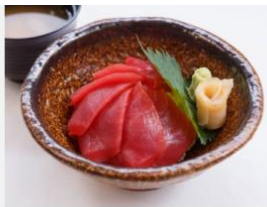
ATUM - SALMÃO AMARELA PEIXES