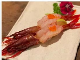
CAMARÃO CARABINEIRO CRUSTÁCEOS