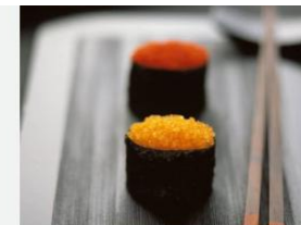
OVAS DE PEIXE VOADOR - TONIKO OVAS