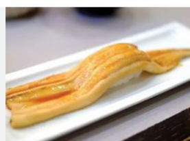
NI-ANAGO ENCHIA DO MAR EDOMAEZUSHI PREPARADOS