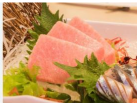
ATUM - BLUEFIN PEIXES