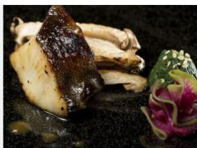
BLACK COD PEIXES