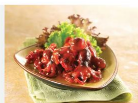
CHUKA TIDAKO PREPARADOS