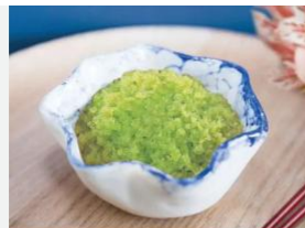
MASAGO WASABI OVAS DE CAPELIN OVAS