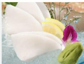
ESCOLAR - PEIXE PRETO PEIXES