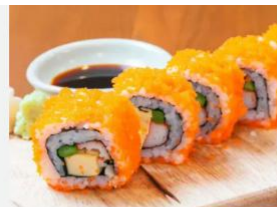
OVAS DE CAPELIN - MASSAGO OVAS