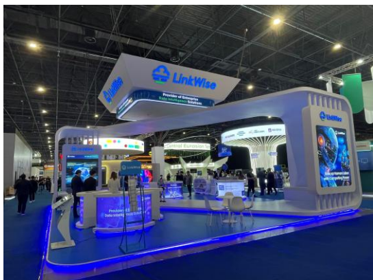
▲展示会場（中国企業ブース）