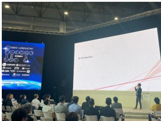
▲会場内でのセミナー