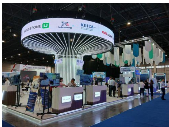
▲展示会場（韓国パビリオン）