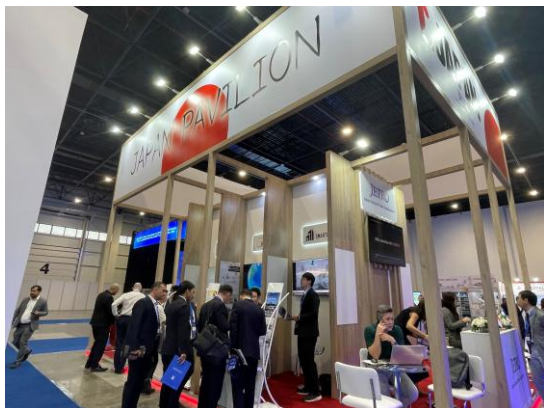
▲ジャパン・パビリオン