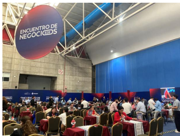
▲B2B商談エリアの様子