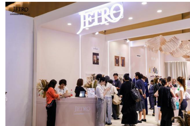
（写真）昨年度ジャパンパビリオンの様子