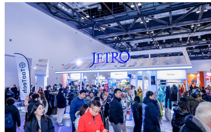
(写真) 昨年度ジャパンパビリオンの様子