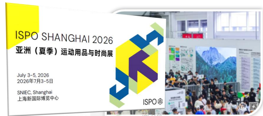
（写真）2026年度 募集案内の表紙