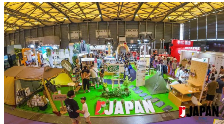
（写真）昨年度ジャパンパビリオンの様子