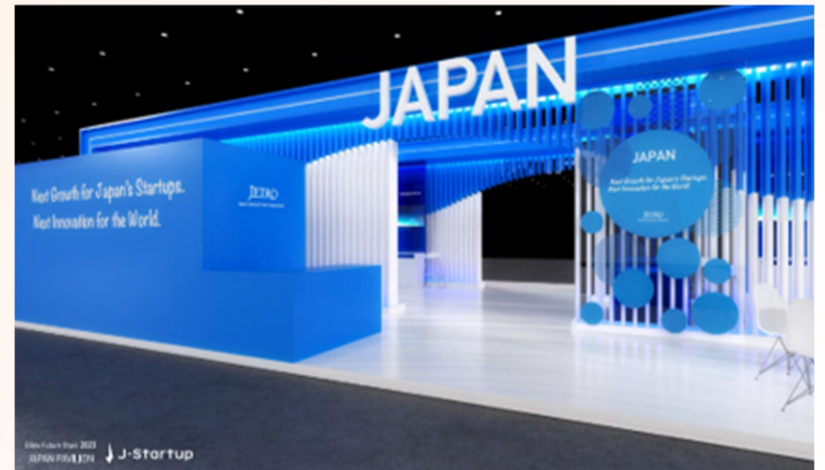
▲昨年度のブース外観▲