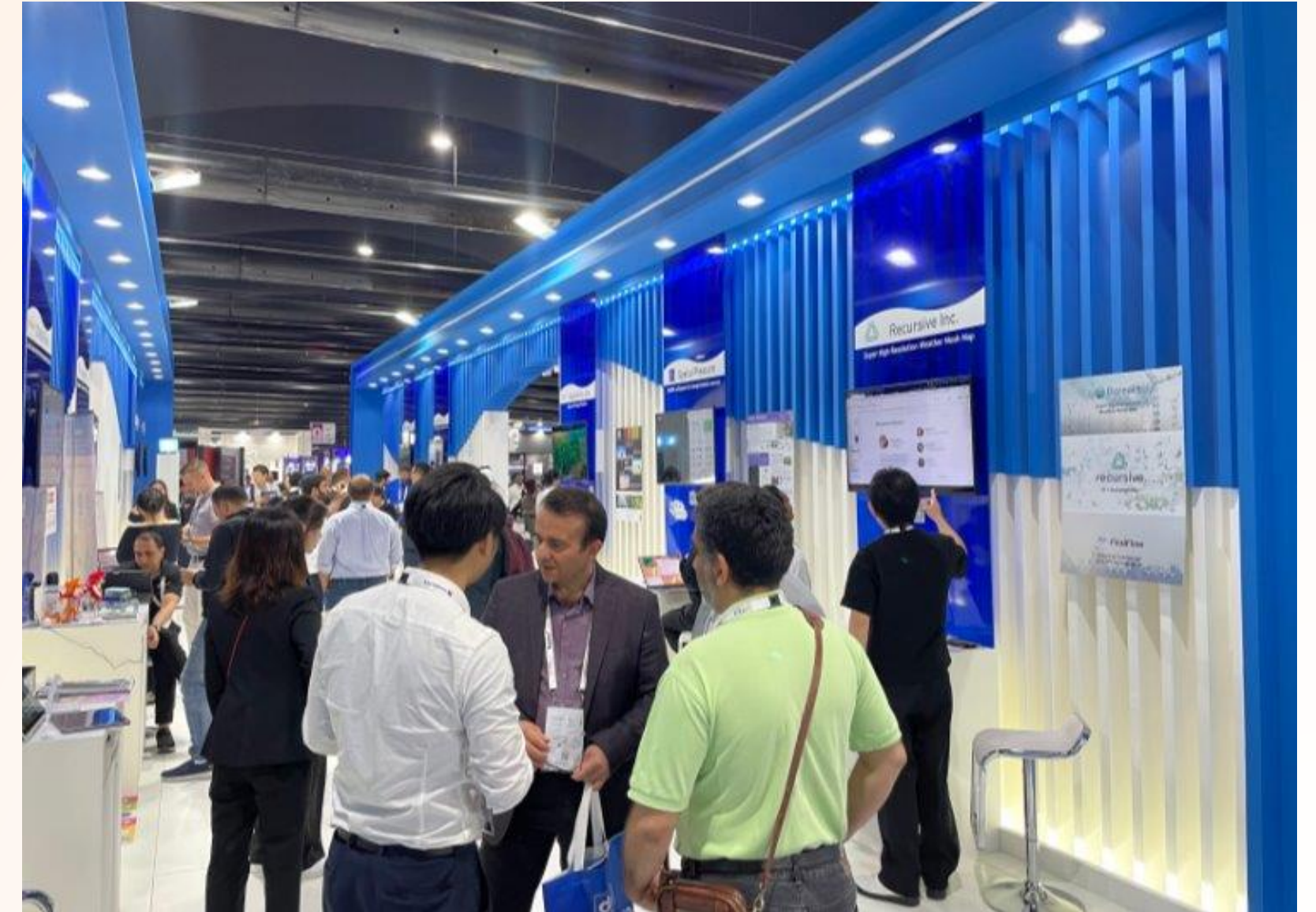
昨年度は総勢18社の企業がJ-Startupパビリオンへ出展しました。