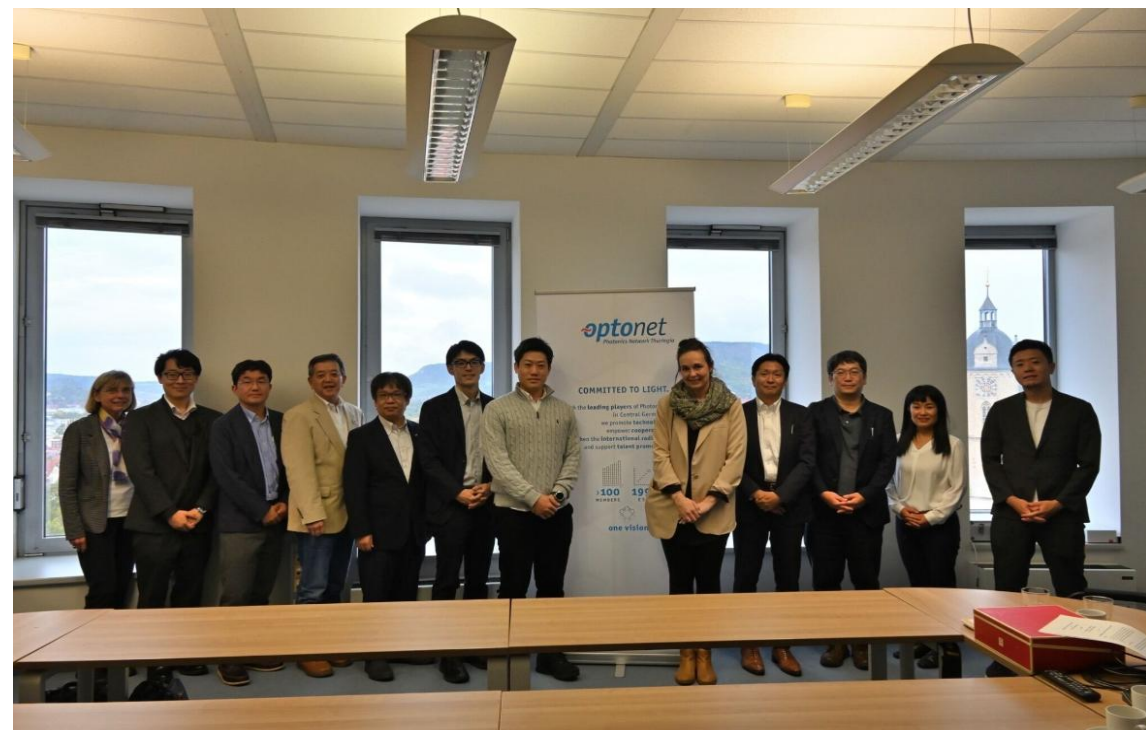
2024年度ベルリン派遣の際の様子