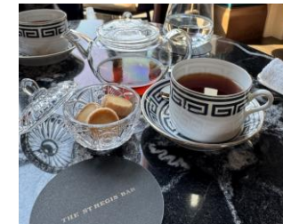
紅茶代理店 (JINGTEA *英国)

貿易業務を通じ暮らしの向上、環境保全に貢献することを使命とし、その実現に邁進します。