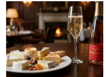
シャンパンOEM (フランス)