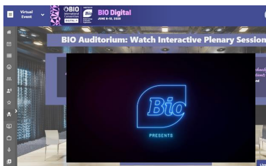
主催者提供のセミナーも視聴可能