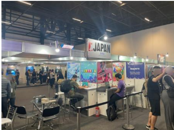
Brasil Game Show 2025の様子