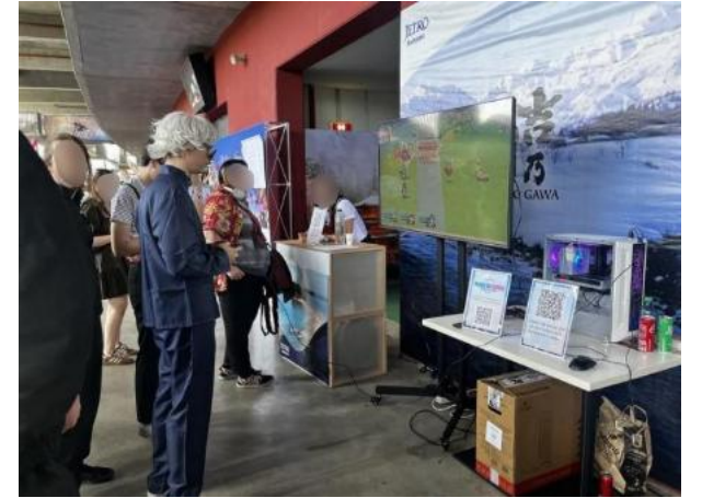
East European Comic Conの様子