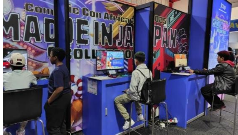
Comic Con Africaの様子