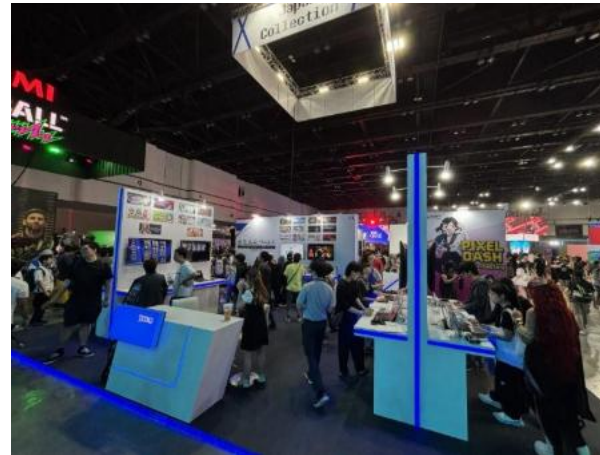
gamescom asia x Thailand Game Show の様子