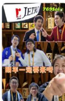
【工具人の日常】进博会充实的一天