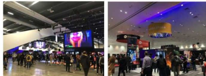
会場の様子