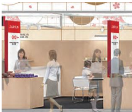
小間外観イメージ