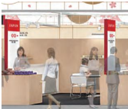
小間外観イメージ