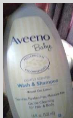
ベビィウォッシュ & シャンプー Aveeno