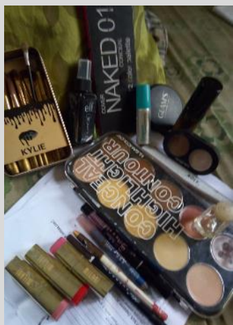
メイクアップ各種

■ 普段あまりメイクをしないが、メイクをする時は専門のメイクアップアーティストに依頼する。