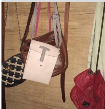
鞆、靴のコレクション