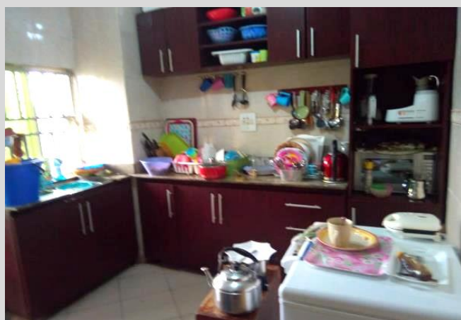
キッチン（コンロはガス式）