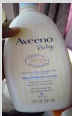
ベビーローション Aveeno