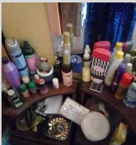
ボディー・ヘアクリーム各種

■ 普段あまりメイクをしないが、メイクをする時は専門のメイクアップアーティストに依頼する。