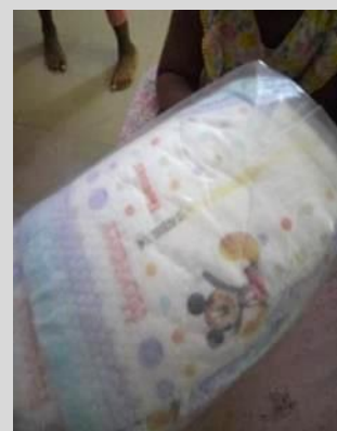
オムツ (Pampers, Huggies)