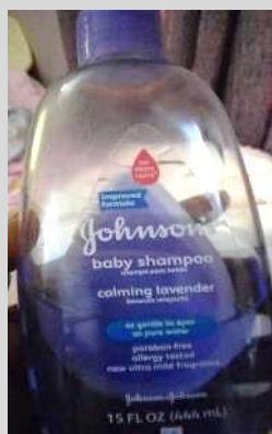
ベビィシャンプー Johnson's