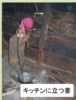
キッチンに立つ妻