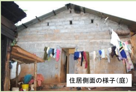
住居側面の様子(庭)