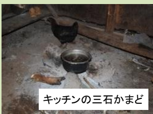
キッチンの三石かまど