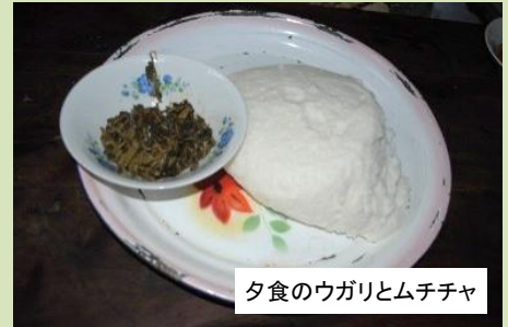
夕食のウガリとムチチャ