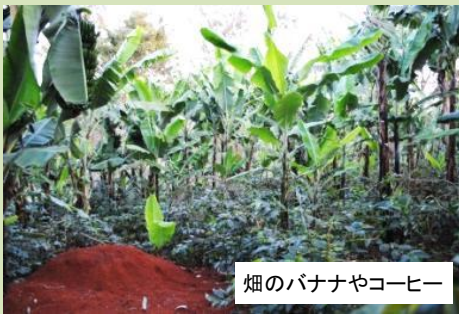
畑のバナナやコーヒー