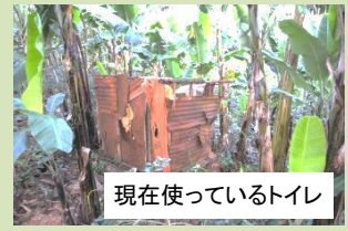
現在使っているトイレ