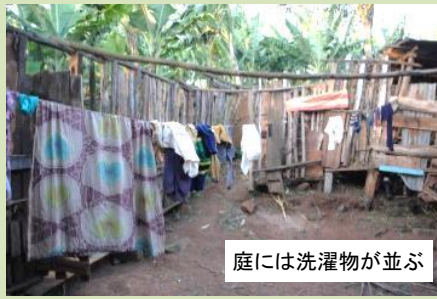
庭には洗濯物が並ぶ