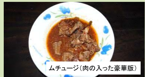
ムチュージ(肉の入った豪華版)