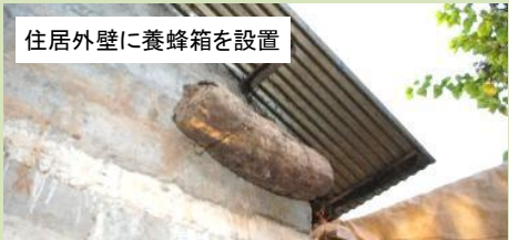
住居外壁に養蜂箱を設置