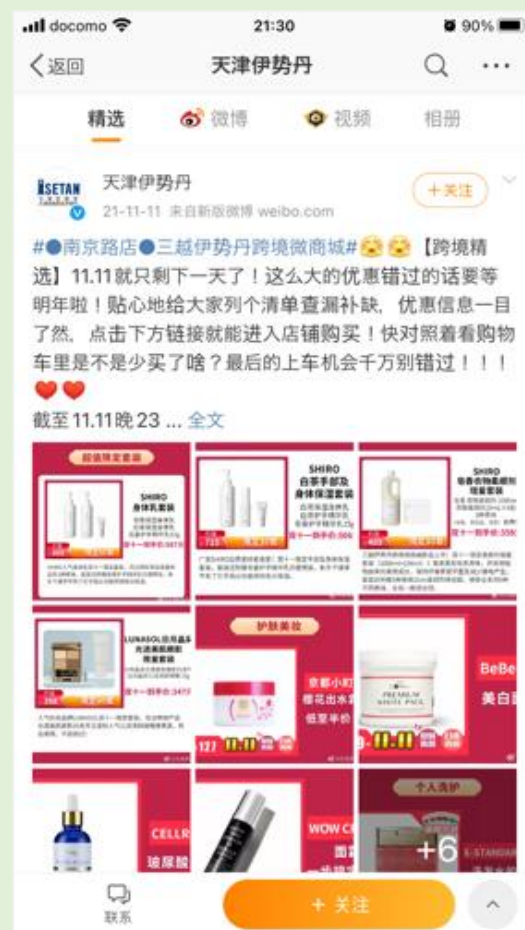
天津:2万フォロワー