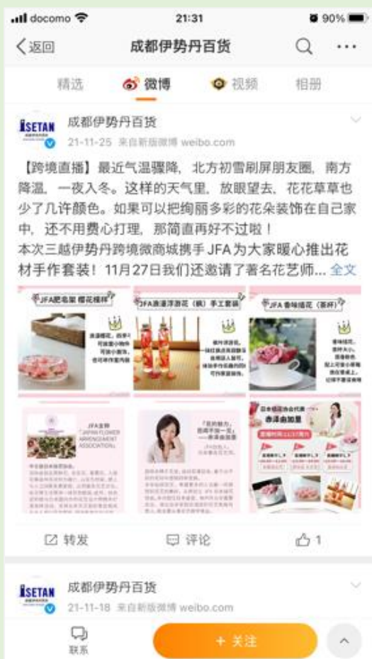
成都:1万フォロワー