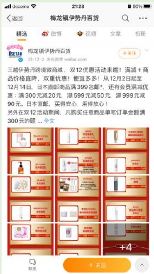
上海:6.6万フォロワー